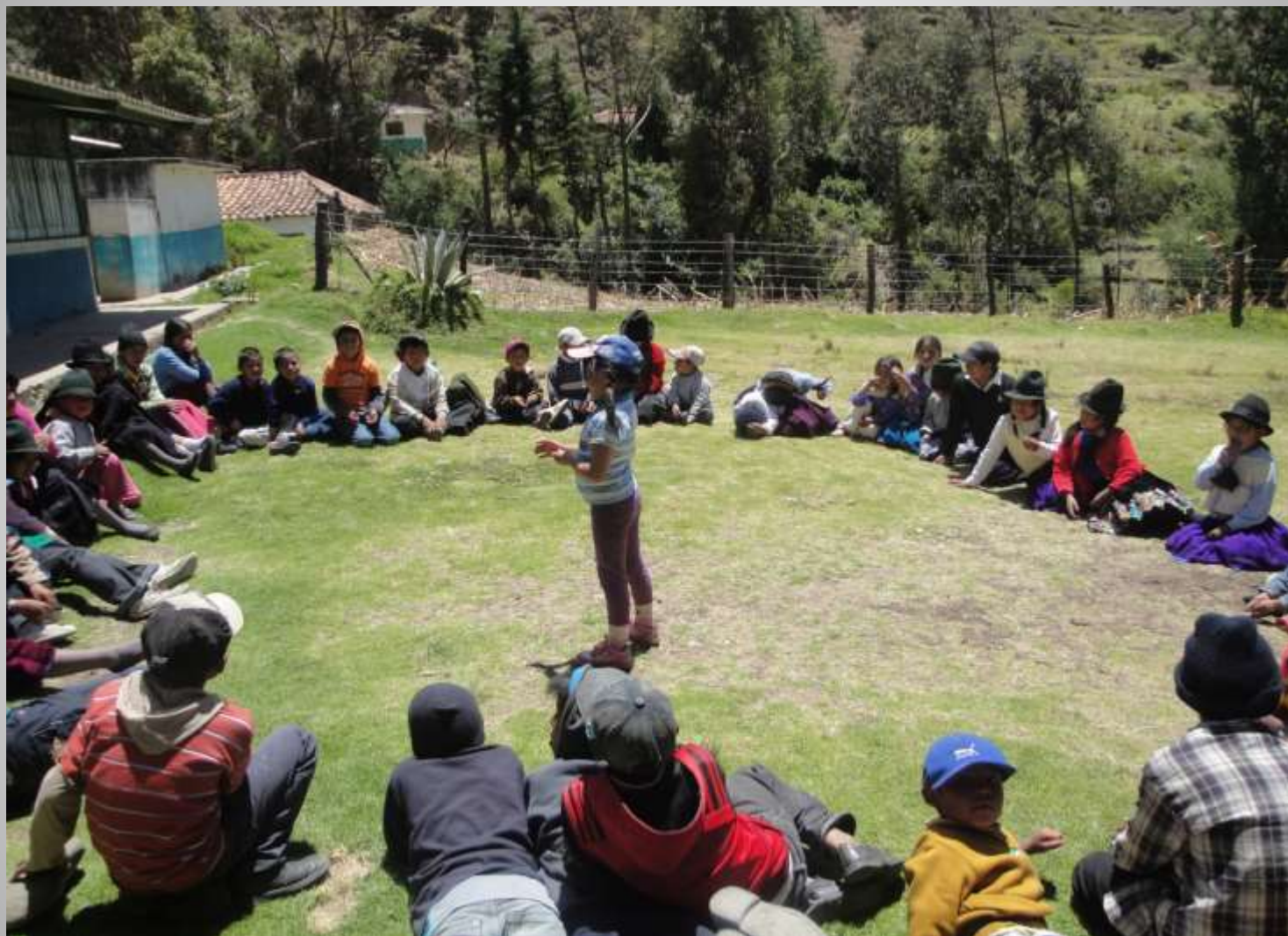
Socialización previa a la conformación de los concejos consultivos